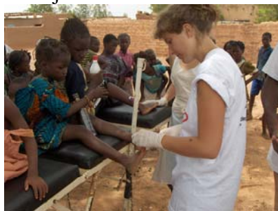
Soins lors d'une maraude

Le premier est un partenariat avec une association burkinabé, « Vivre APED », association de protection de l'enfance en danger qui facilite l'accès aux soins aux défavorisés et réinsère les jeunes en les formant à un métier.